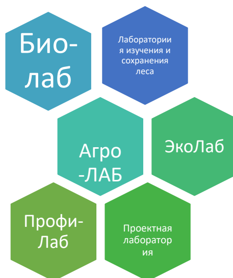
Рис. 2 Лабораторные пространства

На рис. 2 и 3 можно рассмотреть несколько решений проектирования структуры лабораторных пространств.